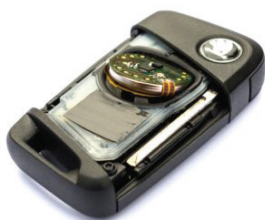
Čip vložený v klíči

Funkce čipu je založena na pohybovém senzoru, který rozpozná, že klíče nejsou používány a odpojí baterii od klíče. Ten poté není možno zneužít k dálkovému napadení vozidla. Jakmile čip zaznamená pohyb, opět baterii připojí a klíče normálně fungují. Na standardní funkci klíče nemá čip žádný vliv. Instalace nenaruší jeho funkci, nedojde k žádnému poškození a ztrátě záruky. Zařízení je patentově chráněno a certifikováno.